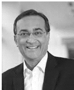
Ajay Bhatt “ Inventor del USB ”