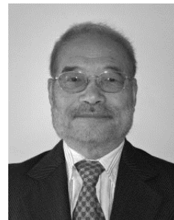
Peter Tsai “ Inventor de la Filtro de máscara N95 ”