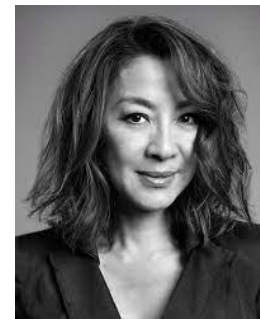
Michelle Yeoh “ Primera mujer asiática en ganar el Oscar por mejor actriz ”