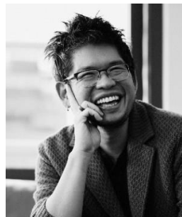
Steve Chen “ Co-fundador de YouTube ”